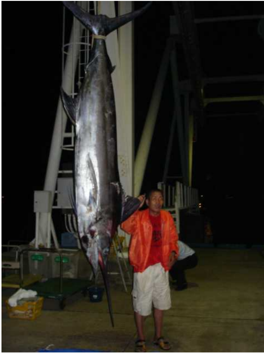
3m24cm 155kg ASHIZURI BLUEと 夢叶い感慨一入の「清風」オーナー

午後8時の帰港後のマグナムスタッフ総出で計量魚拓取りと解体は手際よく、僕も楽をさせて頂きました。夢のサポートご苦労様でした。