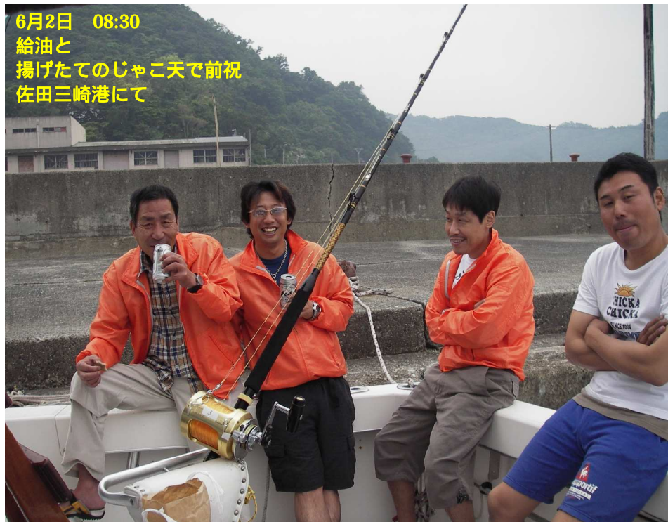
6月2日 08:30 給油と 揚げたてのじゃこ天で前祝 佐田三崎港にて